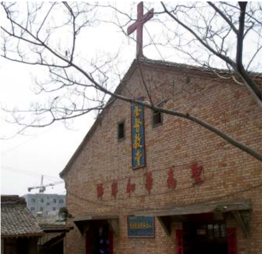
Kyrkolokal i Chengcheng.

Kanske Jesus i första hand hade vänt sig till Kinas växande skara av hiv/aids-positiva om han idag besökt Mittens rike. Jan-Endy Johannesson