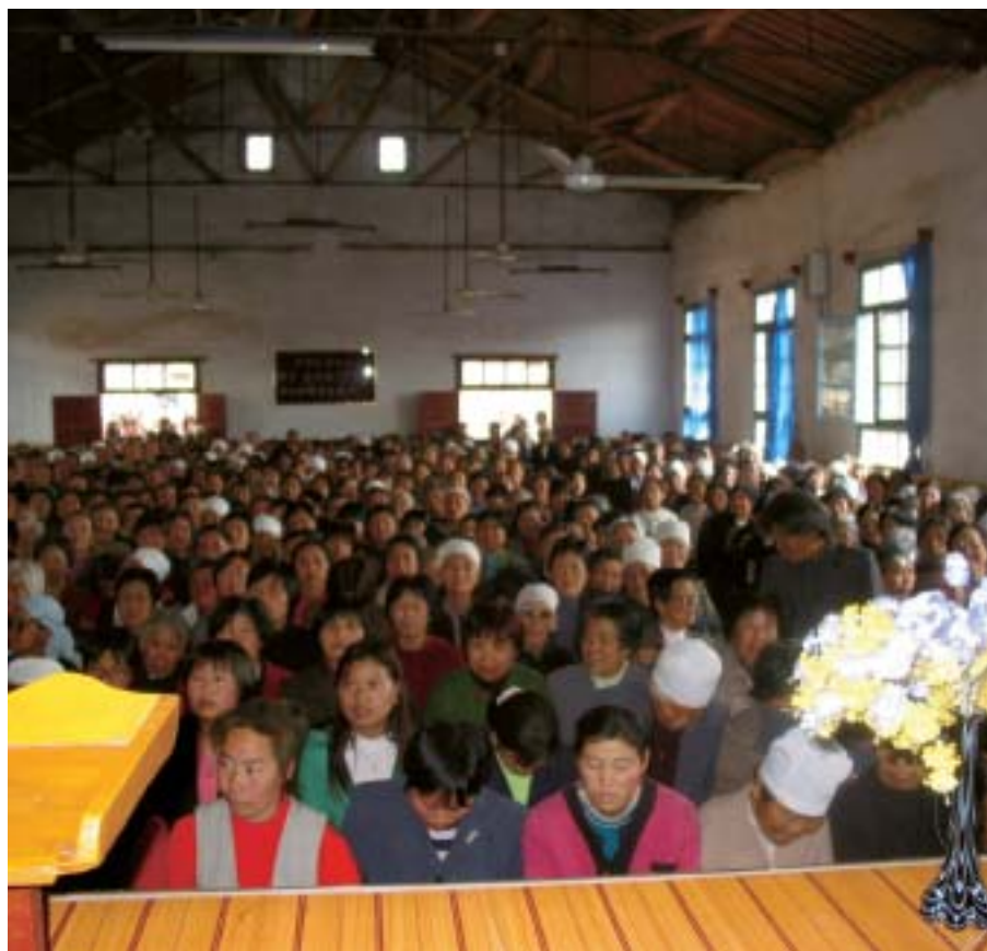
Församling i Chengcheng femton mil nordväst om Xian i provinsen Shaanxi i Kina.

Ekonomiskt sett är Kina på väg att bli en stormakt. Aptiten på stål och olja syns omätligt. Stora handelsöverskott gällande EU och USA vittnar om kinesernas förmåga att producera varor till minst sagt konkurrenskraftiga priser. Staden Shanghai har inom