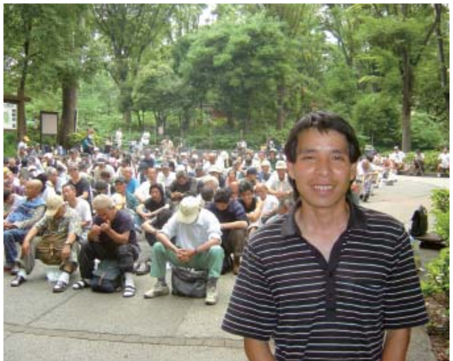
Församlingen i Fuji firar gudstjänst bland hemlösa i Tokyo.