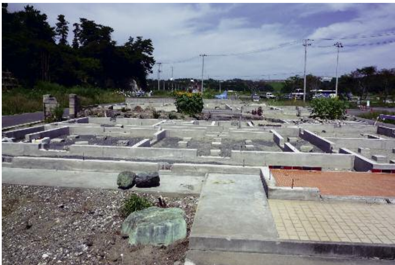
Tsunamivågen var på sina håll över 30 meter hög. Här har den sopat med sig husen och endast lämnat grunderna kvar.