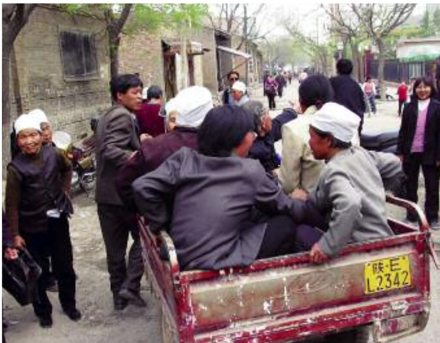
Transportmedlen varierar också 2011. Här några församlingsmedlemmar utanför kyrkporten i Pucheng.