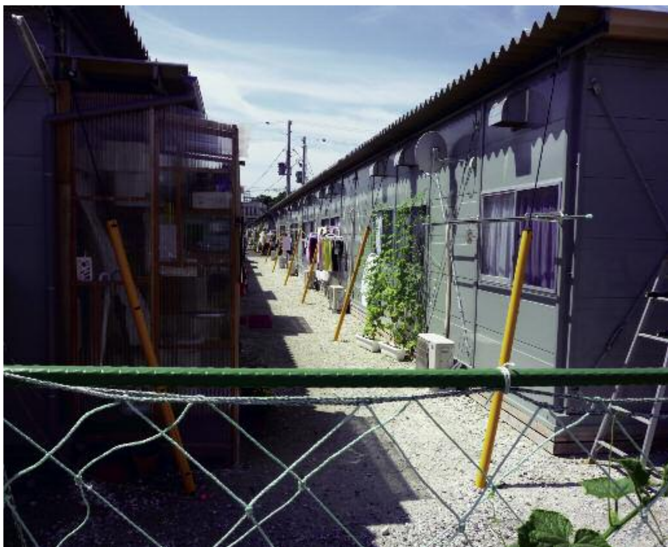
Överallt bygger myndigheterna tillfälliga bostäder för de drabbade.