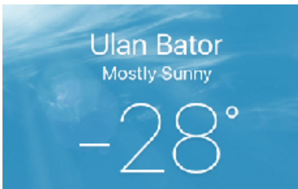
Ulan Bator sägs vara världens kallaste huvudstad.

(Jag kom till Djingis Khans hemland direkt från Egypten där det var +25 grader, så det var en utmaning att packa rätt.)