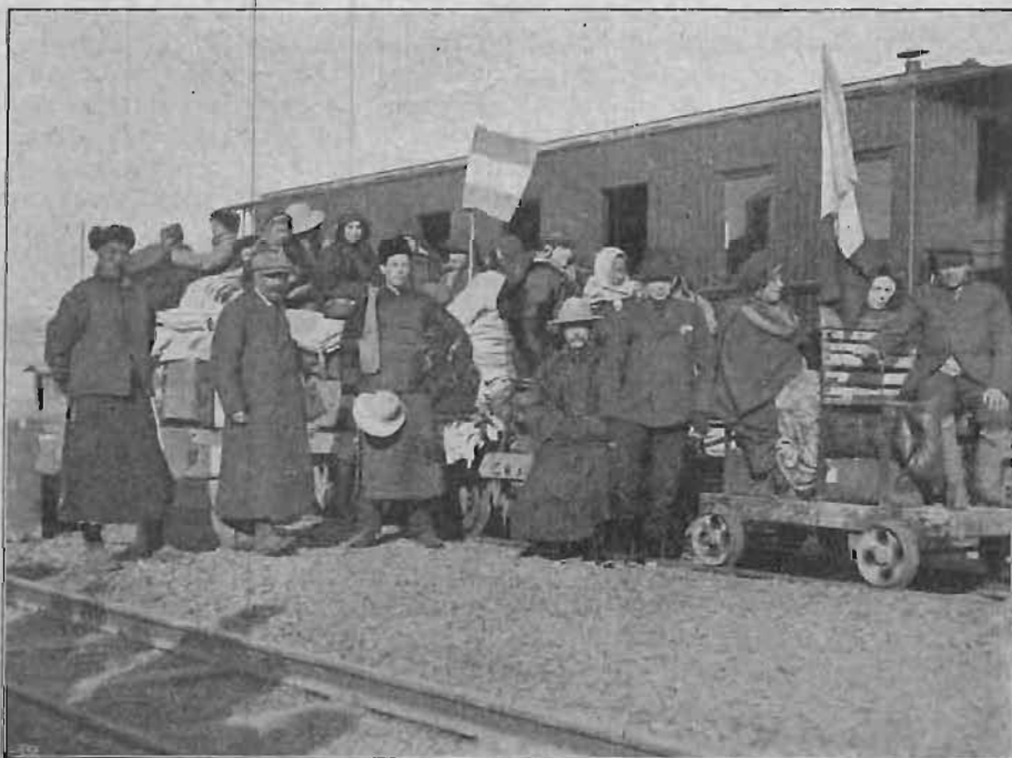
Vårt »tåg» af dressiner, färdigt att starta.

så underbart beredt väg för oss. Den kvällen fingo vi sofva i Röda korsets hospital, förut ett stort värdshus. Vi fingo sedan höra, att där lågo fyrtio sårade soldater. Nästa morgon stego vi på Peking-Hankow järnvägen, som förde oss till Tientsin, dit vi anlände klockan åtta på kvällen, grundligt uttröttade men tacksamma mot Gud, som fört oss dit.