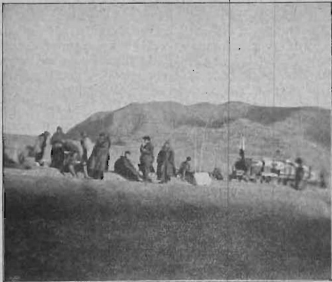
Intagande af »lunch», sedan saker och dressiner burits förbi det skadade stället.

Långt hade vi ej farit, förrän vi stötte på ett lokomotiv, som var förstördt och låg tvärs öfver järnvägs-skenorna. Det var ej annan råd än att packa af och bära säckarna samt dressinerna förbi och så packa på igen. Det samma fingo vi göra, då vi anlände till ett ställe, där skenorna voro förstörda.