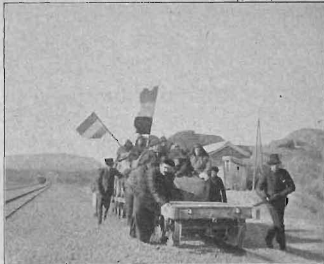
»Bröderna fingo gå af och skjuta på.»

På onsdagsmorgonen lyckades männen få tag i fyra dressiner, hvilka bundos tillsammans. Vårt bagage lastades på; våra sängklädspåsar lades ofvanpå, och till sist satte vi oss själfva öfverst. Fyra kineser voro med för att hjälpa till att skjuta på. Vårt "tåg" startade klockan elfva f. m. Om vi någonsin känt, att vi voro beroende af Gud, var