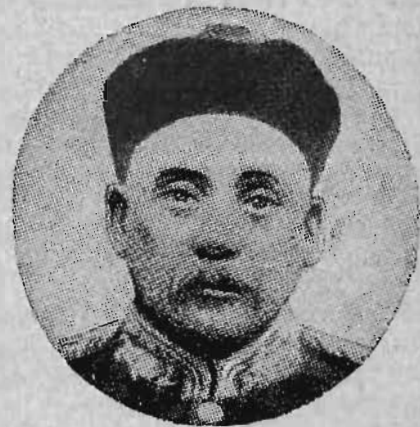
Kinas konset/President Yuan-Shi-Kai.

Genom de öppnade fönstren hördes regementsmusiken spela den kinesiska nationalsången.