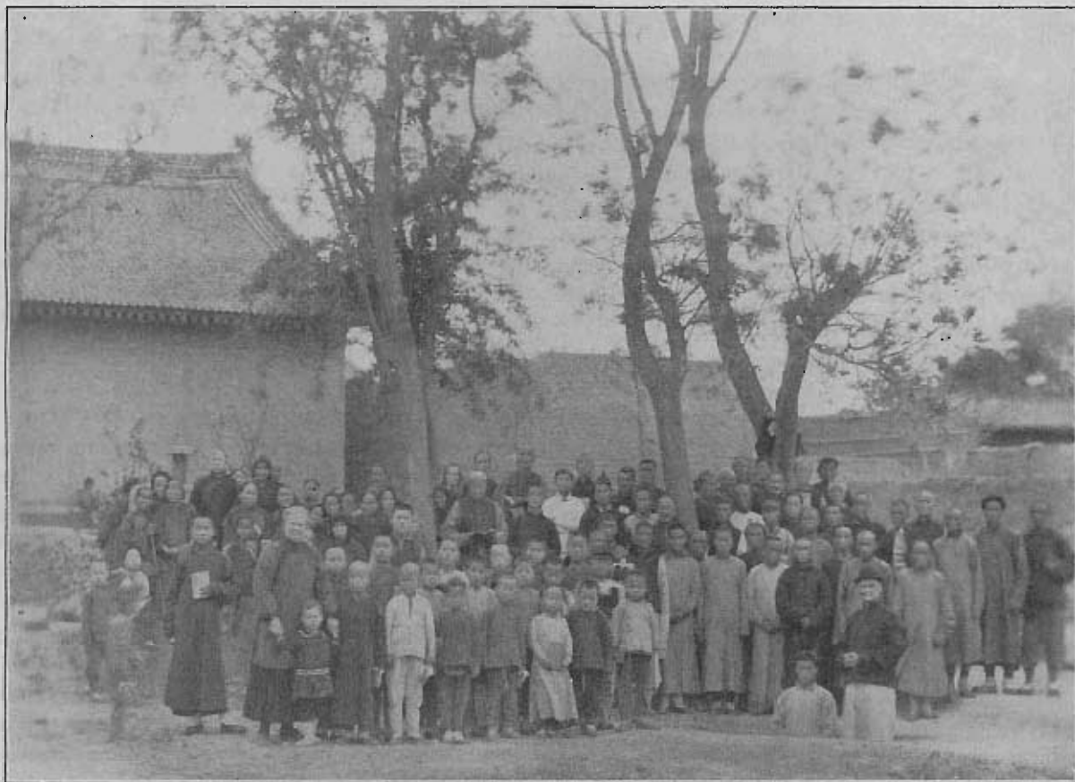
Från dopakten i Pucheng den 6 maj 1916.

Innehåll: Hvad som är visare och starkare än människor. — Skrifven till missionärerna! — Missionärsinvigningen i Eksjö — Några intryck från missionsledarekonferensen. — Brefafdelningen. — En stor Gud. — Nyantagen missionsarbetare. — För S. M. K:s bedjande vänner. — Adress. — Litteraturanmälan. — Hans stjärna i Östern. — S. M. K:s bönemöten. — Försäljning.