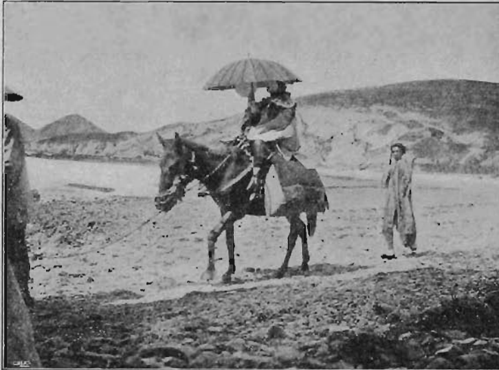
På väg hem.

Efter middagen den tredje dagen i högtiden är allmänt uppbrott. Värdfolket måste vara överallt och annorstädes. Varje liten gumma vill säga adjö och få några glada, varma, uppmuntrande avskedsord med på vägen. Och det lyser i gamla skrynkliga ansikten, och »pingan» ljuder del från ung och gammal.