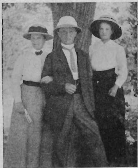
»Värdfolket och deras unga brorsdotter.»

Över stad och land bredde natten sitt mörker. Därinne på missionsstationen var allt lyst och stilla. Ljusen voro släckta, och alla hade gått till vila. Men det dröjde länge, innan jag kunde somna. En dallrande återglans från de strålande julljusen hade dröjt