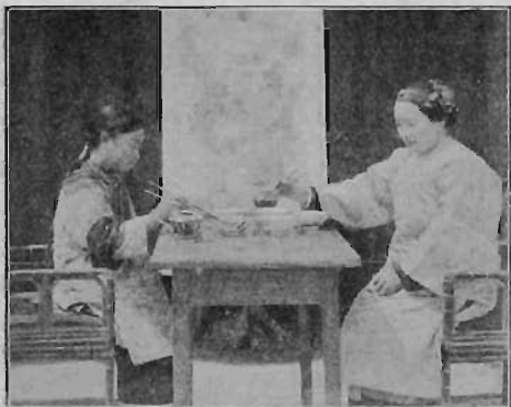
Kinesiska kvinnor intaga sin måltid.

Det sprakas i alla gästrum. Både de manliga och kvinnliga missionärerna på platsen, evangelisterna och bibelkvinnorna äro i full verksamhet. Det gäller att inte försumma någon eller något. Efter några timmar ringer det till förmiddagsgudstjänst, och sedan den är slutad, intaga utänningar och kineser gemensamt julumiddag.