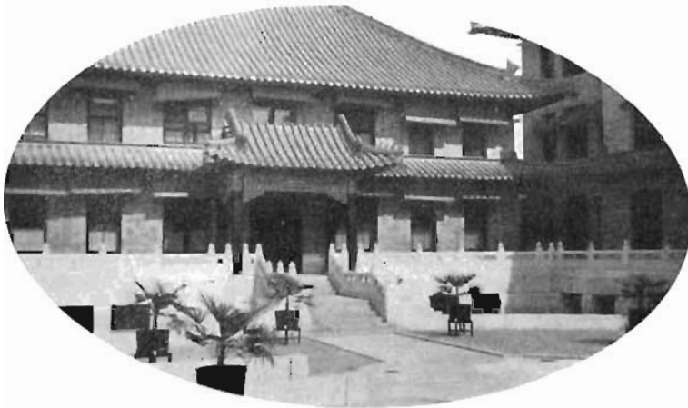
Skolbyggnad i Peiping.

4) I skolundervisningen ha stora framsteg blivit gjorda. År 1912 funnos blott 4 universitet i riket. År 1936 hade Kina 82 universitet och 29 högre läroverk. För det stora antal vetenskap-