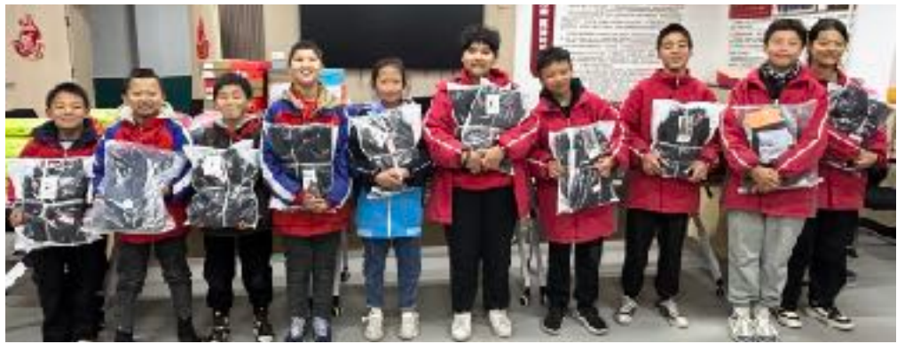
En hälsning från barnhemmet i Sanyuan Dongzhou. Här med sina nya kläder.