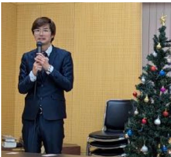
Saito-san samlar kristna i Ohio varje söndag.

Ohito kyrka och pastorsbostad revs ner till grunden förra året. Byggnaderna var fallfärdiga och man var orolig för vad som kunde hända under tyfoner och jordbävningar.